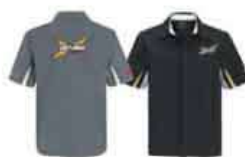
Вид сзади Черный (90)

Хлопок – 97%, спандекс – 3% Размеры: M, L, XL, 2XL, 3XL 453380 Темно-серый (07), Черный (90)