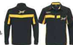
Вид сзади Черный (90)

Хлопок – 98%, спандекс – 2% Размеры: S, M, L, XL, 2XL, 3XL 453381 Белый (01), Черный (90)