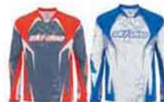
Красный (30) Голубой (80)

453365 Красный (30), Голубой (80), Черный (90)