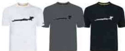
Белый (01) Темно-серый (07) Черный (90)

Хлопок – 100% Размеры: M, L, XL, 2XL 453387 Белый (01), Темно-серый (07), Голубой (80), Черный (90)