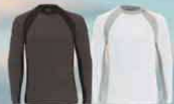
Коричневый (04) Дымчатый (38)

Хлопок – 100% Размеры: M, L, XL, 2XL 453377 Коричневый (04), Дымчатый (38), Черный (90)