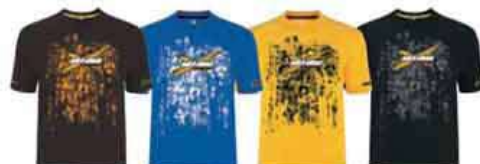
Коричневый (04) Голубой (80) Желтый (10) Черный (90)

Хлопок – 100% Размеры: M, L, XL, 2XL 453388 Коричневый (04), Желтый (10), Красный (30), Голубой (80), Черный (90)