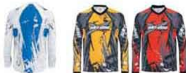
Вид сзади Желтый (10) Красный (30)

453364 Желтый (10), Красный (30), Дымчатый (38)