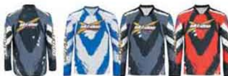
Вид сзади Дымчатый (38) Черный (90) Красный (30)

453366 Желтый (10), Красный (30), Дымчатый (38), Черный (90)