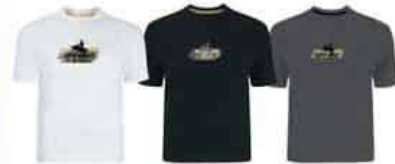
Белый (01) Черный (90) Темно-серый (07)

Хлопок – 100% Размеры: M, L, XL, 2XL 453384 Белый (01), Темно-серый (07), Желтый (10), Черный (90)